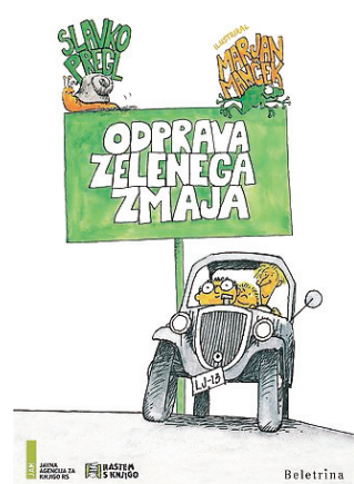
Naslovnici letos izbranih knjig