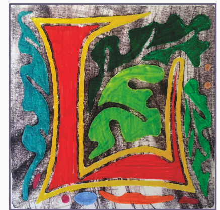
(CUDV Črna na Koroškem)

Mišlim, da lahko preko risb za trenutek uzremo občutenja, čustva in misli udeležencev. Lahko smo jim hvaležni, da so nam omogočili to potovanje in vpogled v svoje notranje svetove, ki so nedvomno bogati, dožveti in predvsem iskreni. Koliko ljudi bi take stvari delilo?